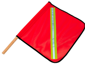
Banderolas Warning flag