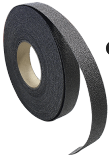
Cinta antiderrapante Anti-slip tape