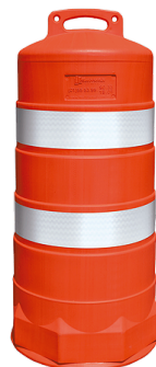
Delimitadores viales Delineators