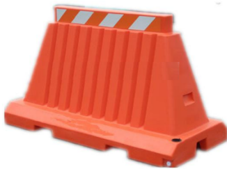
Barrera vial Traffic barricade