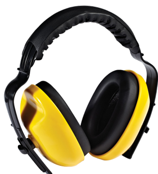
Protectores auditivos Head earmuffs