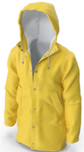
Impermeables Waterproof jacket