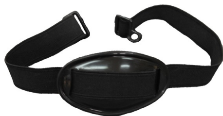
Barbiquejo Chin strap