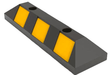
Tope de estacionamiento Parking bumper